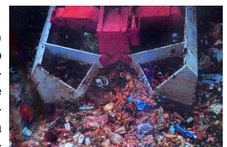
Residuos en el búnker de recepción.

El RSU (Residuo Sólido Urbano) es un verdadero problema debido a su inconsistencia y heterogeneidad. Es una mezcla indefinida de materia orgánica y varios materiales inertes. Por lo tanto una planta para el tratamiento de RSU requiere un alto grado de flexibilidad.