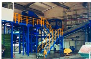
Sala de preparación.

En el turbo-dissolver se introduce una cantidad de agua por medio de un sistema forzado capaz de desintegrar la materia orgánica por debajo del tamaño de su fibra formando una pasta que no afecta a los restantes materiales inertes.