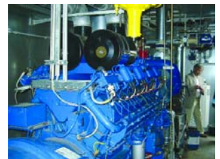
Conjunto generador gas motor.