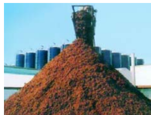
"Compost" luego de la digestión anaeróbica.

La fracción líquida que se forma después de la digestión es seca por medio de un filtro prensa (32) para separar los restantes residuos sólidos. Esta fracción seca, llamada Bio-Compost , forma una substancia parecida a un abono que tiene buen olor y que puede ser usada directamente para mejorar el rendimiento de tierras agrícolas. El resto del agua se recicla y vuelve a ser prensa hasta encontrar las últimas partículas sólidas (33).